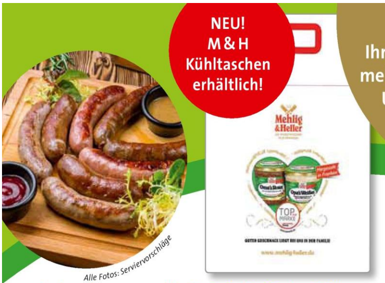
Alle Fotos: Serviervorschläge